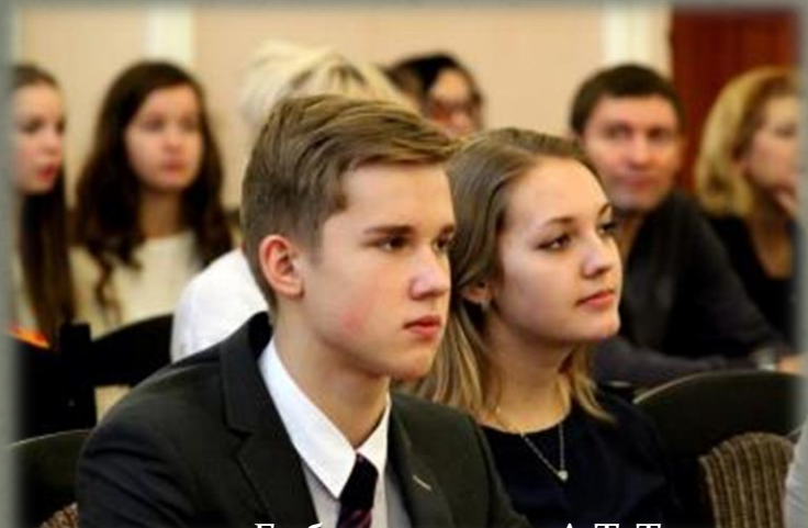
Участники слета. Библиотека им. А.Т. Твардовского

Проведен областной слет Смоленской области по школьному краеведению «Край мой Смоленский», посвященного 190-летию восстания декабристов» на базе ГБУК «Смоленская областная универсальная библиотека им. А.Т. Твардовского» (ноябрь 2015 года), общим количеством участников – 199 человек.