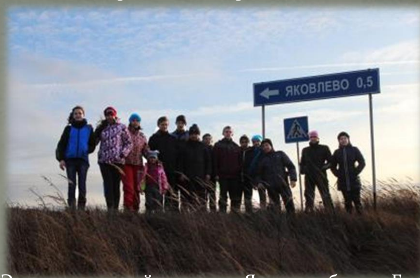
Экспедиционный отряд в д. Яковлево близ д. Горня