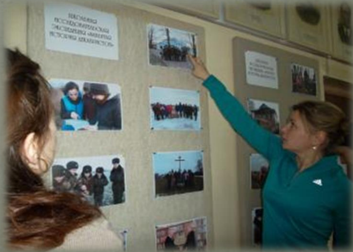
Научно-практическая конференция «Товарищ, верь!»