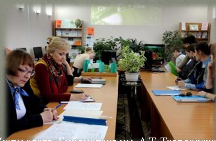
Жюри слета. Библиотека им. А.Т. Твардовского