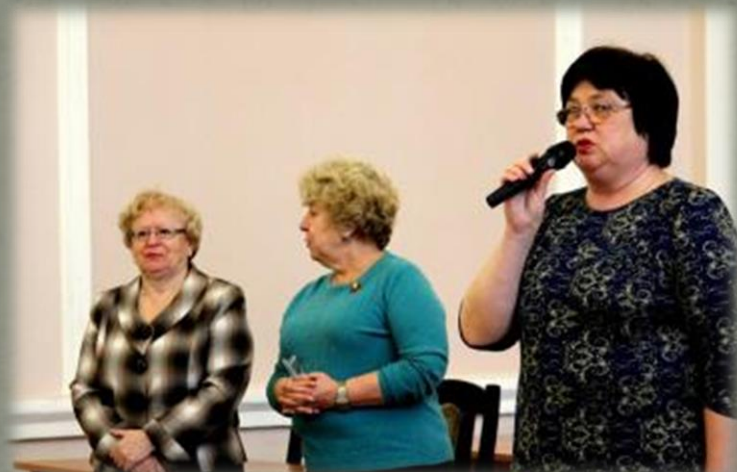
Организаторы слета. Библиотека им. А.Т. Твардовского