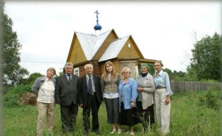
Краеведы и местные жители в д. Новояковлевичи

1. предварительные исследовательские выезды на местность экспедиционными группами местных краеведческих кружков в августе-октябре 2015 года (при участии местных жителей по необходимости):