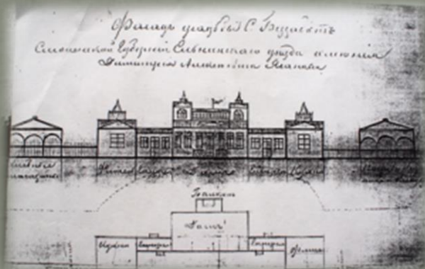
Фасад усадьбы в д. Беззаботы