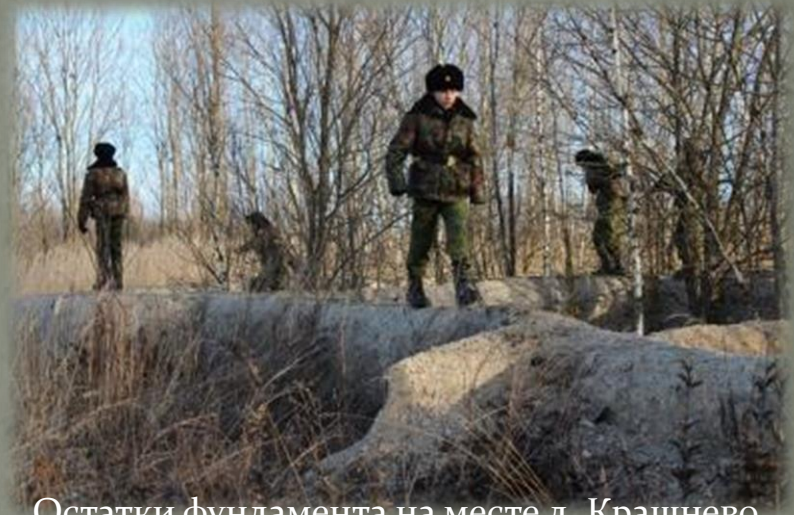
Остатки фундамента на месте д. Крашнево.