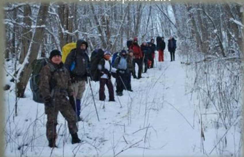
Экспедиционный отряд в Духовщинском районе.