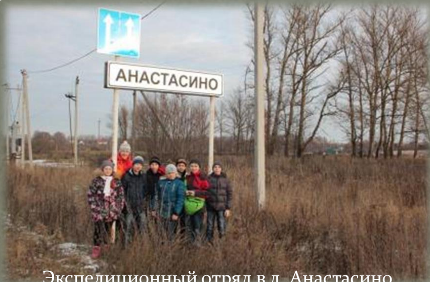
Экспедиционный отряд в д. Анастасино

В проведении полевых исследований приняло участие: 1. из числа обучающихся СОГБОУДОД «Детско-юношеский центр туризма, краеведения и спорта» - 85 человек; 2. из числа обучающихся краеведческих кружков образовательных организаций (школ), расположенных вблизи изучаемых объектов - 31 человек.