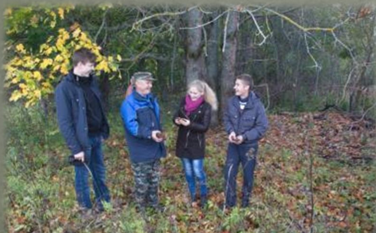
Участники экспедиции и старожилы в д. Буловицы