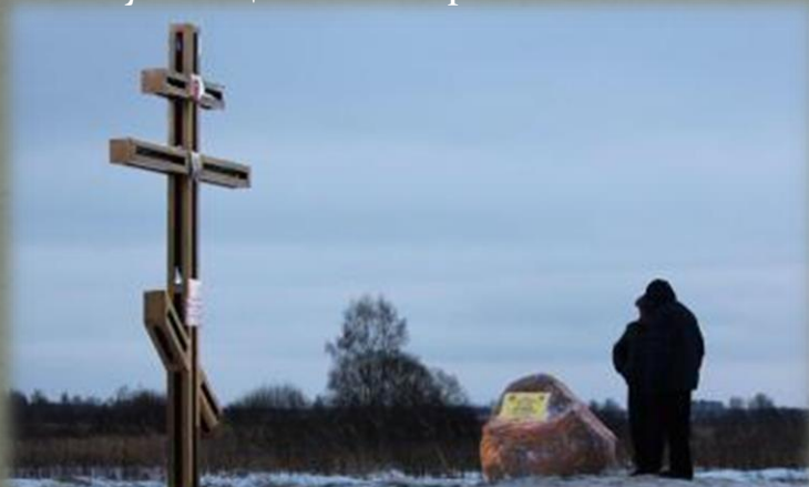
Памятный знак в д. Буловицы.