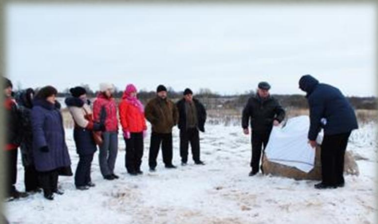
Торжественное открытие памятного знака в д. Буловицы.