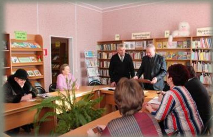
Торжественная передача памятной таблички.

3. Установка памятных табличек согласовывалась с главами администраций и местными краеведческими музеями. Была достигнута договоренность о том, что таблички будут установлены силами местных администраций. Так, например, в январе 2016 года состоялась торжественная передача таблички, посвященной Петру Григорьевичу Каховскому, администрации Смоленского района. Она будет закреплена на огромном камне, который будет установлен в с. Митино весной 2016 года.