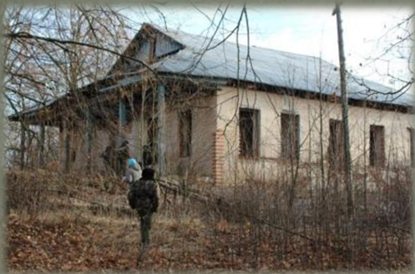
Остатки усадьбы Пассека в д. Беззаботы