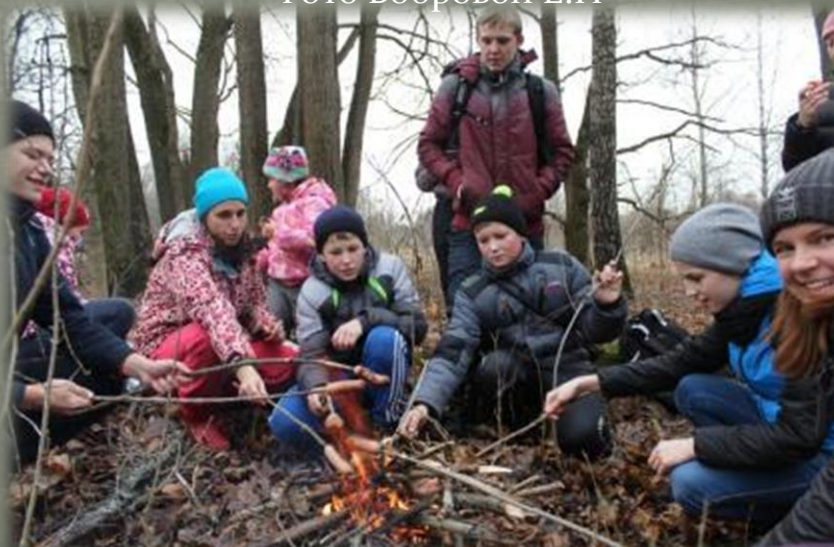
Экспедиционный отряд в д. Горня