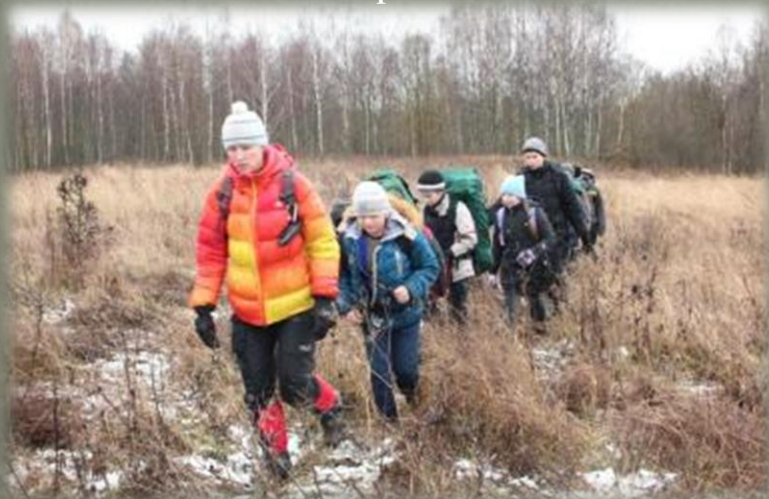
Экспедиционный отряд в Монастырщинском районе