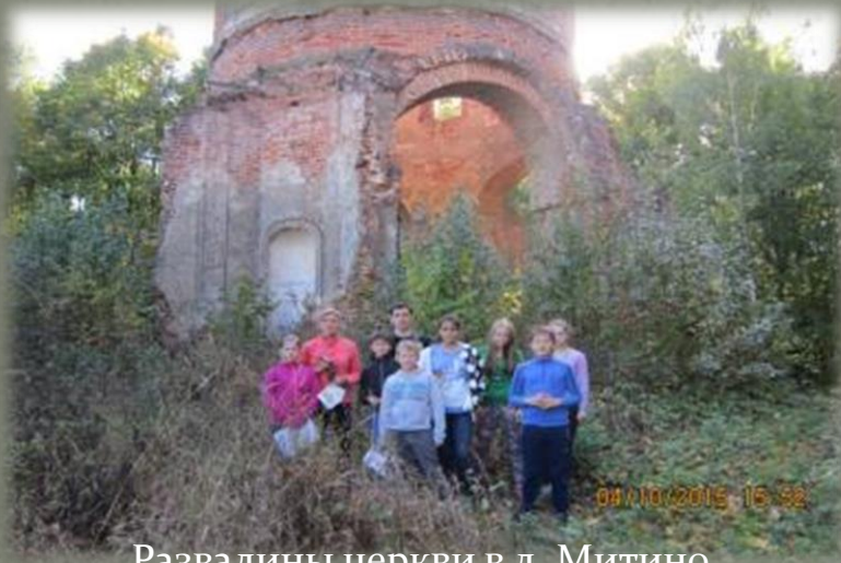
Развалины церкви в д. Митино.

2. исследовательские выезды на местность и однодневные пешие походы обучающихся творческих объединений СОГБОУДОД «Детско-юношеский центр туризма, краеведения и спорта» в октябре-декабре 2015 года: