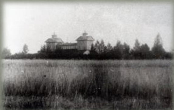
Фотография усадьбы в д. Беззаботы начала XX века