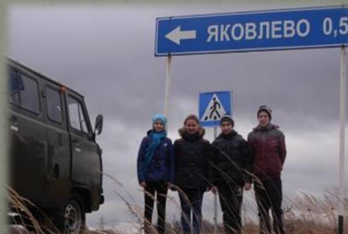
Участники экспедиции в д. Яковлево близ д. Горня