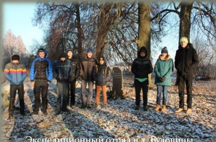
Экспедиционный отряд в д. Буловицы