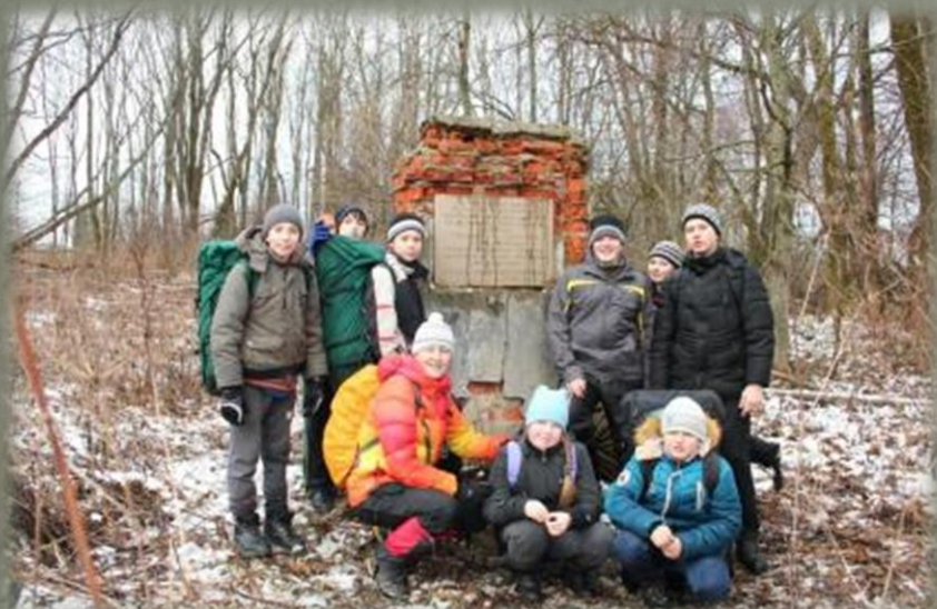
Памятный знак поставлен в д. Васильево в 1974 году