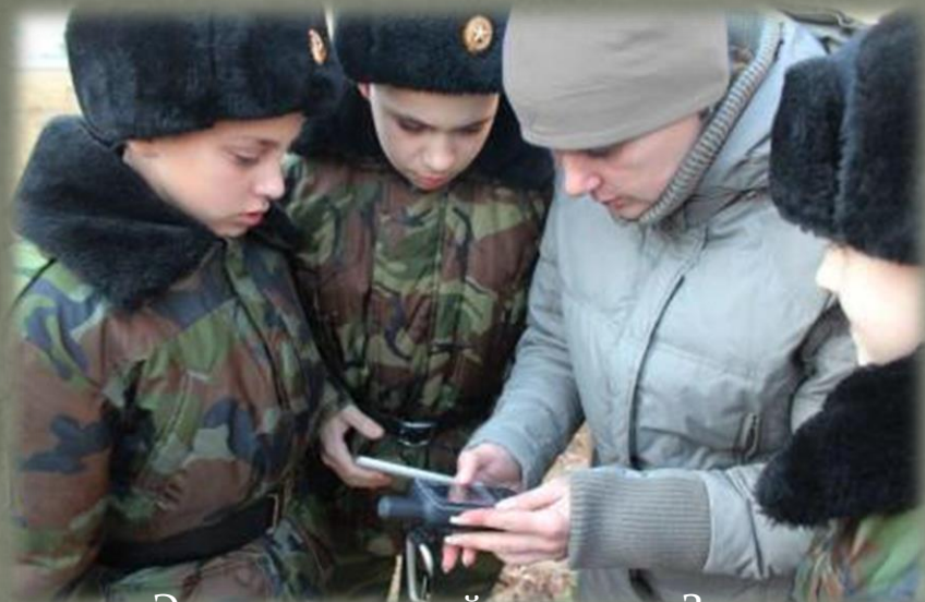
Экспедиционный отряд в д. Закуп

В процессе исследований наносились координаты населенных пунктов, в том числе и уже несуществующих, подъездные дороги (маршруты) к ним. Опрашивались местные жители, описывалась местность, где некогда находились усадьбы декабристов, и сохранившиеся объекты.