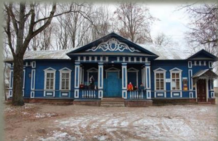
Дом П.Г. Каховского в д. Жуково