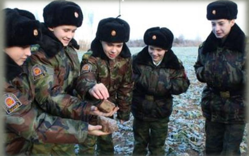
Фрагменты кирпичей на месте д. Крашнево