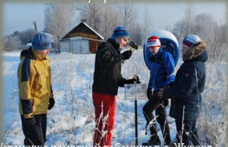
Установка памятной таблички в д. Жуково Сафоновского района.