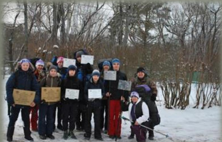
Участники экспедиции с памятными табличками

1. В целях разработки познавательного краеведческого пешеходного маршрута и установки памятных табличек был проведен учебно-тренировочный поход в Духовщинский район Смоленской области. В походе приняли участие 14 человек