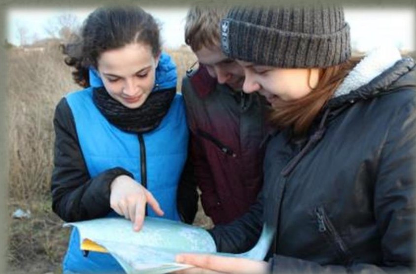
Экспедиционный отряд в д. Горня