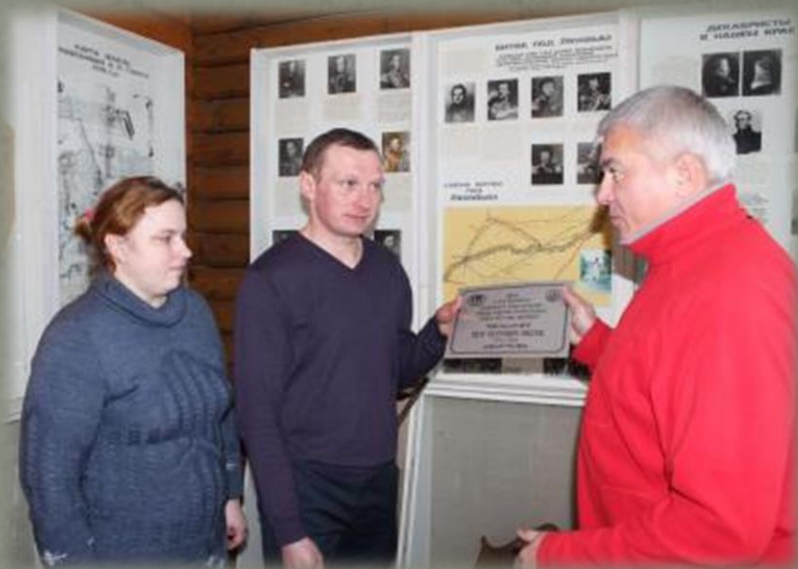
Торжественная передача таблички в Глинковском краеведческом музее.