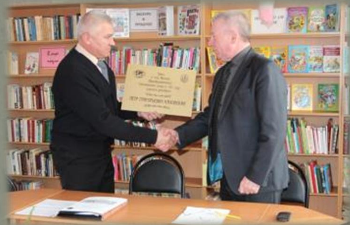
Торжественная передача памятной таблички.