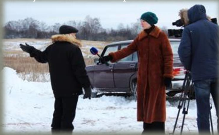
Местный житель дает интервью Смоленскому телевидению.