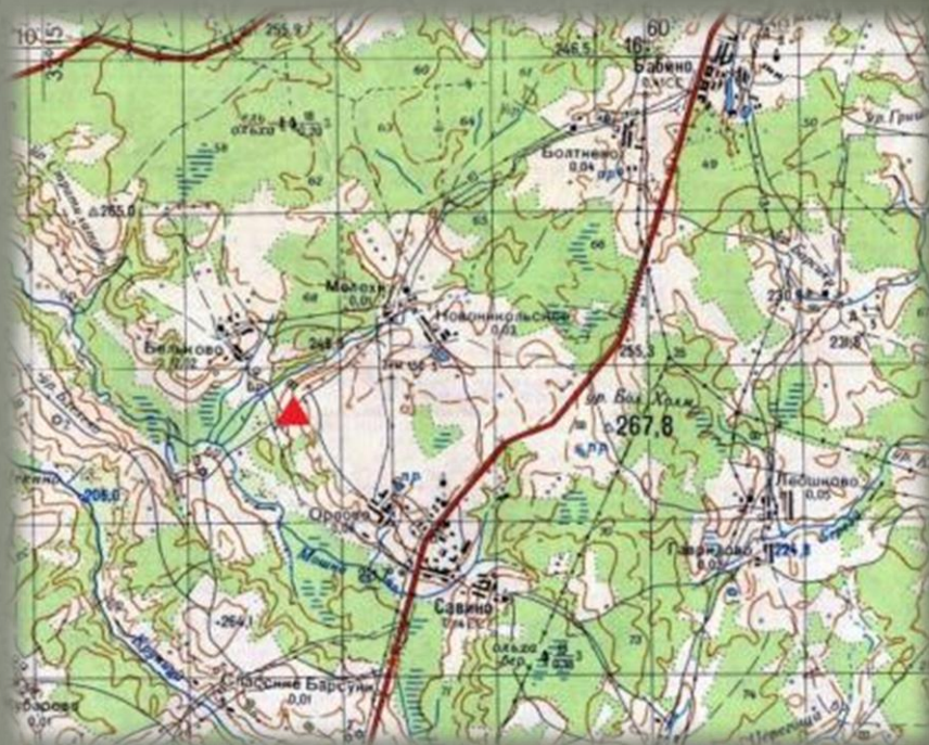
Д. Сутоки на карте 2005 года