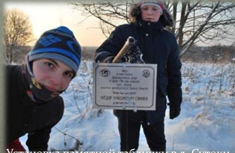
Установка памятной таблички в д. Сутоки.