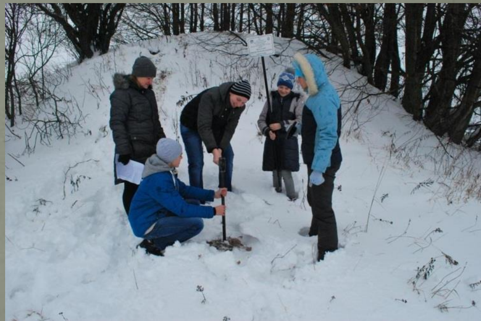
Установка памятной таблички в д. Смоляничи.