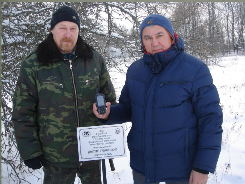
Установка памятной таблички в д. Горня.

5. Памятные знаки были установлены силами сотрудников и обучающихся СОГБОУДОД «Детско-юношеский центр туризма, краеведения и спорта» в ныне несуществующей деревне Горня Дорогобужского района декабристу Грохольскому Дмитрию и в ныне несуществующей деревне Смоляничи Монастырщинского района декабристу Александру Михайловичу Каховскому.