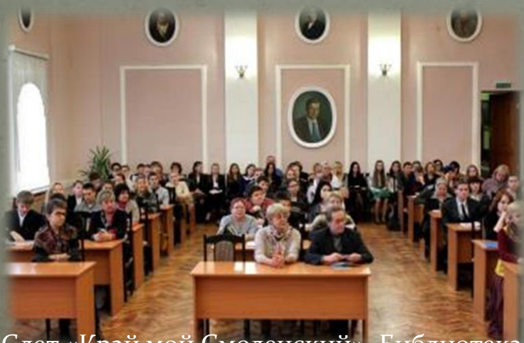
Слет «Край мой Смоленский». Библиотека им. А.Т. Твардовского.