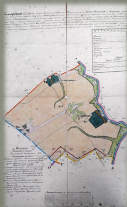
Геометрический специальный план Смоленской губернии Краснинского уезда деревень Бокланова и Алексина