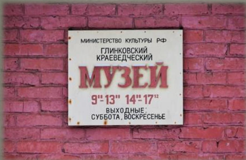
Глинковский краеведческий музей.

Также табличка, посвященная Вильгельму Карловичу Кюхельбекеру, была передана администрации Духовщинского краеведческого музея.