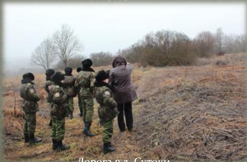
Дорога в д. Сутоки.