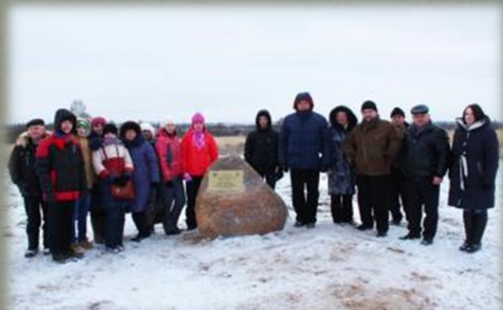
Торжественное открытие памятного знака в д. Буловицы.