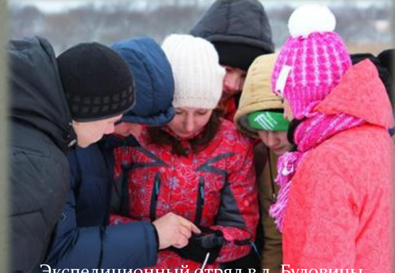
Экспедиционный отряд в д. Буловицы