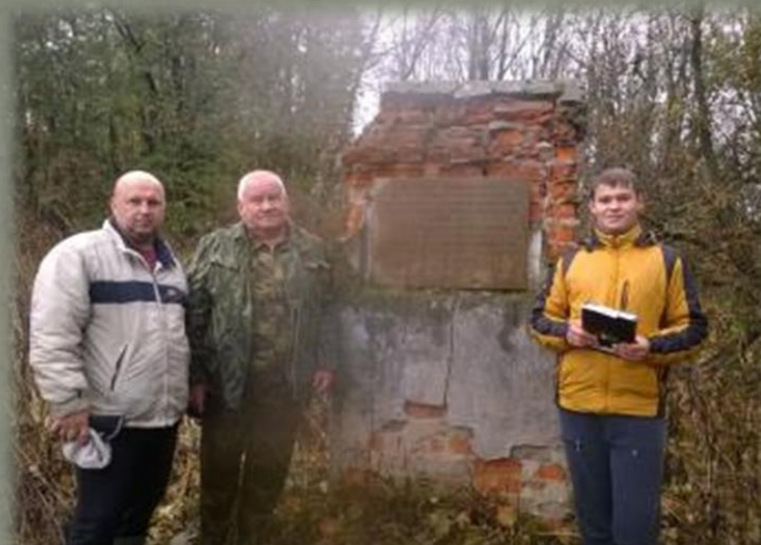
Участники экспедиции в д. Васильево