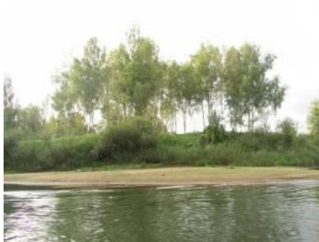
Стоянка в березняке

Далее до д. Городок удобных подходов к берегу не будет. Ширина реки – 30 м., глубина 2-2,5 м. За 1 км. до Городка по правому берегу небольшой песчаный причал – место рыбной ловли местных жителей. Берег крутой, площадка ровная, но абсолютно открытая, без дров.