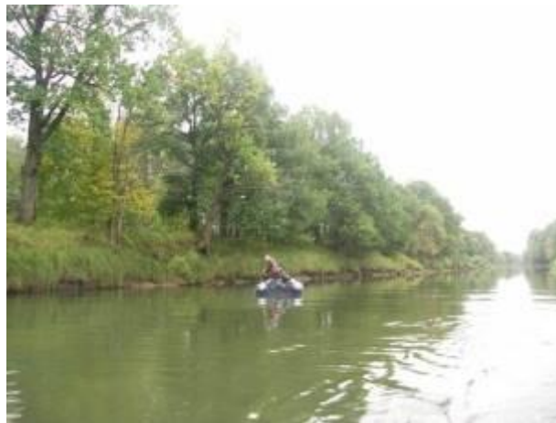
Древесная растительность по берегу реки

Вторая особенность этого участка – обилие песчаных пляжей на внутренних берегах изгибов реки, которые, правда, в большую воду скрываются под водой. Это единственные удобные места для причаливания.