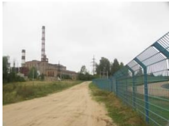
Дорогобужская ГРЭС вид от автодрома

Это место отдыха жителей Верхнеднепровского. Здесь хороший пологий причал и большая поляна с легким уклоном к реке, окруженная мелколиственным лесом. Дорога уходит к турбазе «Ника» (в 0,3 км. от стоянки), к автодрому «Смоленское кольцо» (в 1 км. от стоянки) и в поселок (в 2,5 км. от стоянки). Это место – первая удобная площадка для завершения байдарочного похода (второе – за мостом на Старой Смоленской дороге к востоку от Дорогобужа).