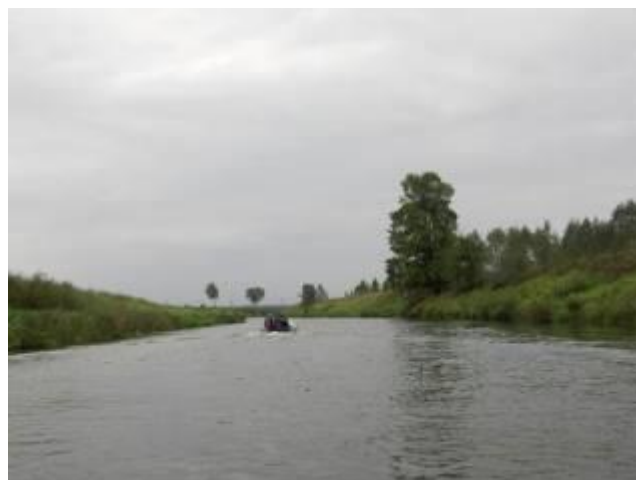
Характер берега на уч. Борок – дд. Мяхново и Зимник

Нередки небольшие перекаты. Так, перед автомобильным железобетонным мостом трассы М1 невысокие деревянные опоры старого моста, за ними под мостом перекат. Учитывая наличие металлической арматуры в русле реки, суда лучше проводить вручную вдоль правого берега.