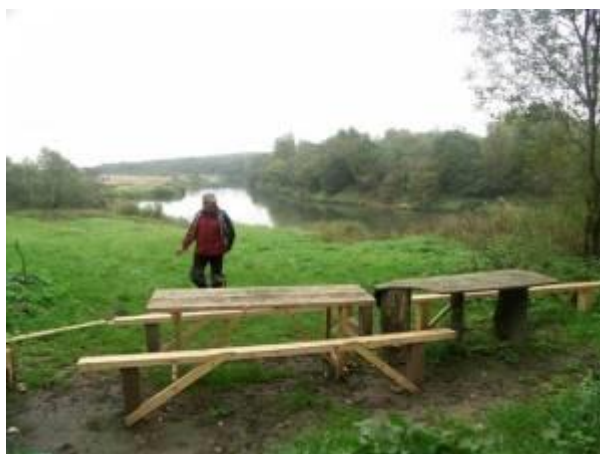
Стоянка перед Верхнеднепровским

Остановиться можно как в палатках (грунты здесь суглинистые, сырые), так и на турбазе «Ника». База небольшая – одноэтажный корпус на 12 номеров (6 «Люкс», 6 «Эконом») с кафе и сауной. Обычно здесь останавливаются участники соревнований, клубных гонок, тест-драйвов и пр., проводимых на автодроме «Смоленское кольцо», куда обязательно следует совершить экскурсию.