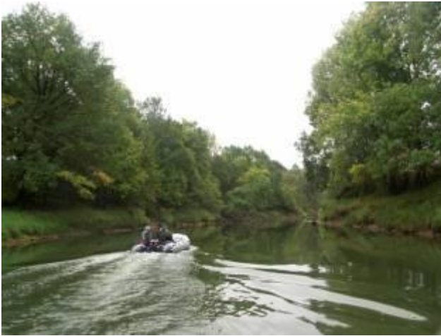
Дубравы ниже Городка