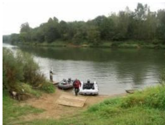
Причал стоянки перед Верхнеднепровским

Остановиться можно как в палатках (грунты здесь суглинистые, сырые), так и на турбазе «Ника». База небольшая – одноэтажный корпус на 12 номеров (6 «Люкс», 6 «Эконом») с кафе и сауной. Обычно здесь останавливаются участники соревнований, клубных гонок, тест-драйвов и пр., проводимых на автодроме «Смоленское кольцо», куда обязательно следует совершить экскурсию.