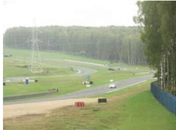
Автодром Смоленское кольцо

На трассе проводятся автомобильные кольцевые гонки всех классов, кроме «Формулы-1». Ежегодно на автодроме проводятся российские соревнования и этапы чемпионата Европы по гонкам грузовиков, клубные гонки.