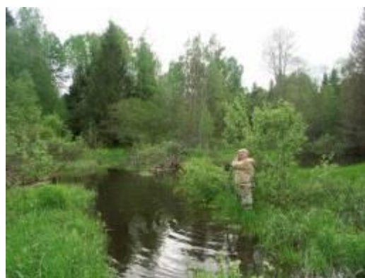
Бобровые запруды в верхнем течении