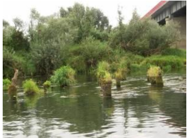
Деревянные опоры у старого моста у трассы М1