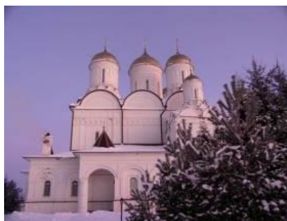
Троицкий собор Болдинского монастыря