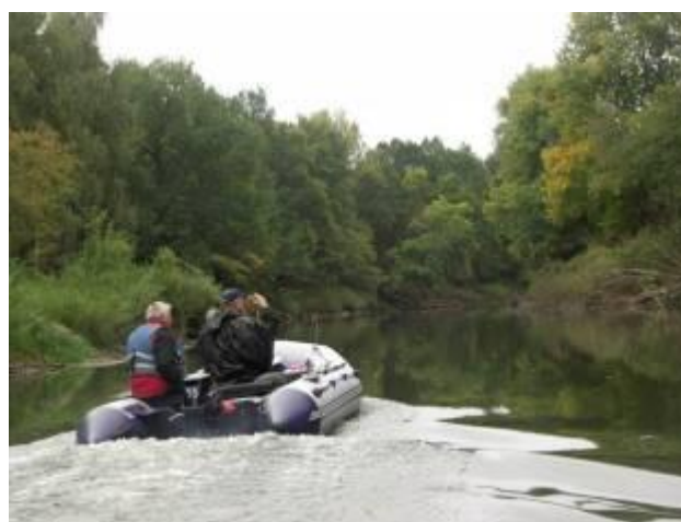
Дубравы ниже Городка