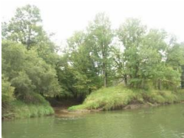
Левый безымянный приток ниже Городка

Далее деревья реддеют, берега становятся крутыми и обрывистыми с большим количеством бобровых нор. Встречаются ямы и заливы, богатые рыбой.