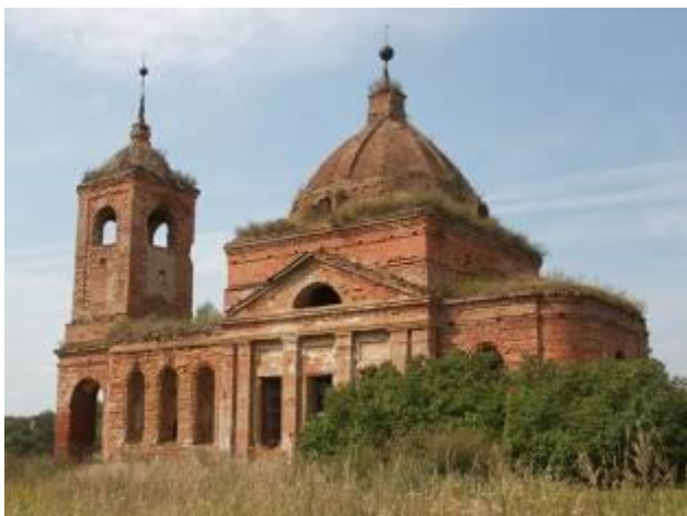
Покровская церковь в Перстенках