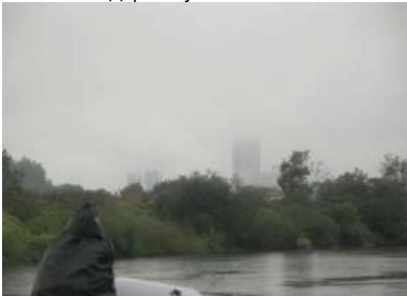
Химпредприятие ОАО Дорогобуж