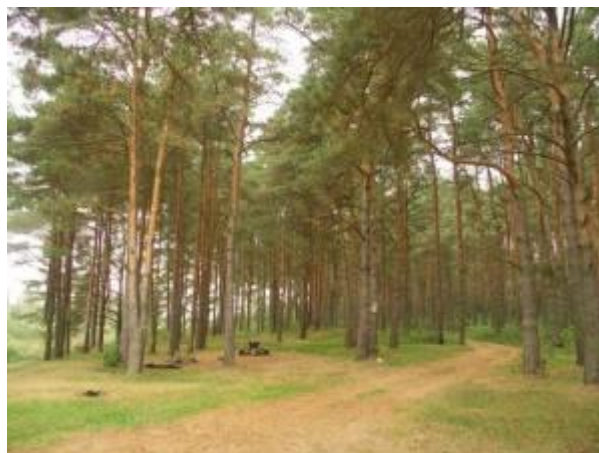
Борок, оборудованная туристская площадка