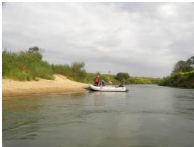
Пляжи перед Монастырщиной

Хороший пляж по левому берегу напротив с. Перстенки. Сюда подходит грунтовая дорога. Над деревней возвышается купол церкви Покрова Пресвятой Богородицы, построенной в 1810 г. на средства помещиков Колтовских. Это кирпичный храм с декором в стиле классицизма: односветный четверик, перекрытый сводом с люкарнами, небольшой трапезной связанный с двухъярусной колокольней. Церковь была закрыта в 1938 г. Сейчас находится в аварийном состоянии.