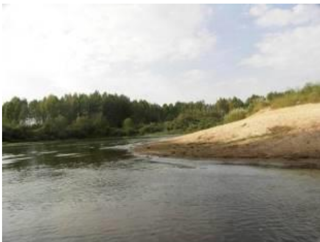
Пляж на выгнутом внутреннем берегу речного изгиба