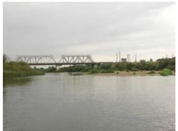
Песчаная отмель перед ж/д мостом

За мостом деревянные сваи старого моста; опасности не представляют.