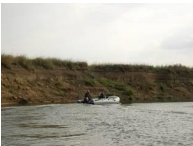
Обрывистый характер берега

В основном же характер берега остается тот же – высота 2-4 м., крутизна не менее 45°, часто берега обрывисты или густо покрытые кустарником.