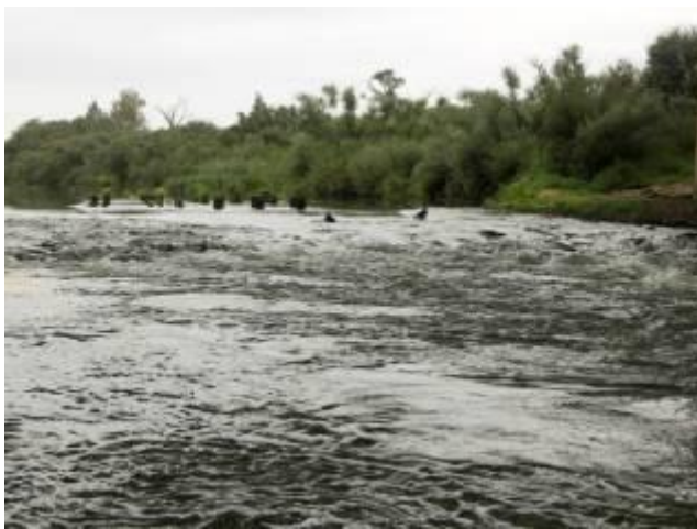
Перекат под а/м мостом трассы М1