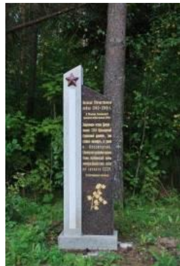
Мемориальная плита и памятник бойцам 119-й Красноярской стрелковой дивизии

В середине 1970-х гг. в районе истока реки была произведена посадка кедра сибирского и сосны, позже был установлен указатель и православный крест.