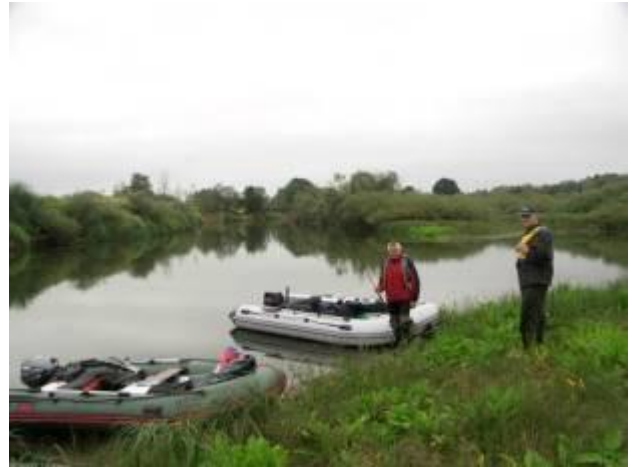
Залив перед ур. Федуркино

Напротив ур. Федуркино по правому берегу хорошее место для организации стоянки: к берегу подходят склоны холма, поросшего березами с примесью дубов. Площадка ровная, но нет хорошего места для причала. Глубина реки у берега более 2 м.