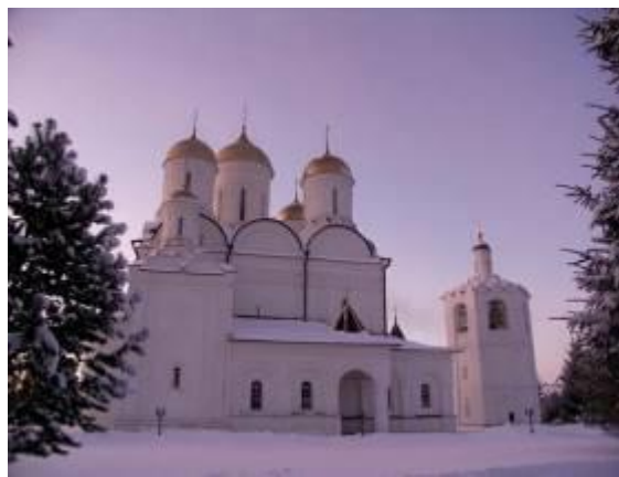
Троицкий собор с трехъярусной колокольней

В период Великой Отечественной войны монастырь был взорван отступавшими немецкими войсками. В настоящее время он полностью восстановлен.