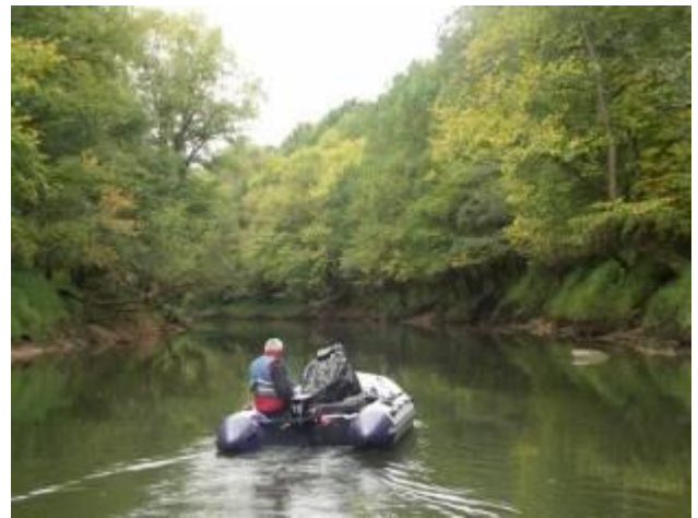
Дубравы ниже ур. Федуркино

Длина этого участка около 1,5 км. Заканчивается он сразу после впадения в Днепр правого притока р. Вопец.