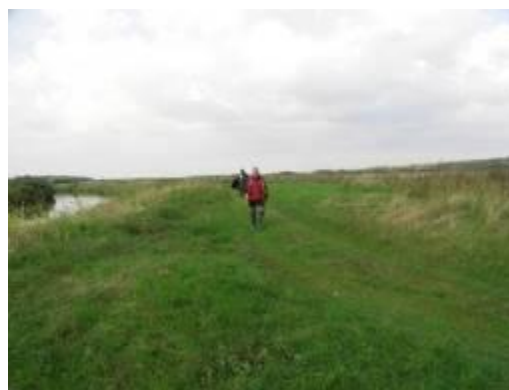
Условия организации стоянок

Источниками чистой воды являются многочисленные небольшие ручьи и мелиоративные каналы (очищенные в связи с отсутствием какой-либо сельскохозяйственной деятельности), в большом количестве впадающие в Днепр по обоим берегам. Хорошим дополнением к организации стоянок у пляжей является тот факт, что часто под внешними (вогнутыми) берегами изгибов реки образуются глубокие ямы, богатые рыбой.