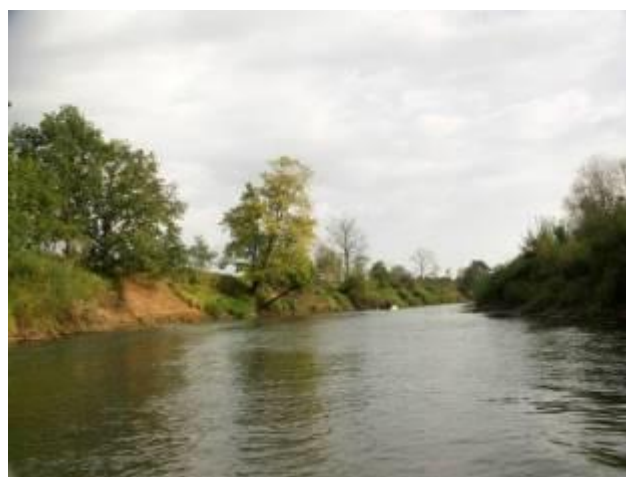
Обрывистый характер берега