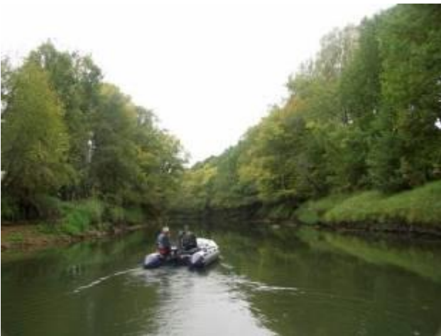
Дубравы ниже ур. Федуркино

Ниже ур. Федуркино начинается вторая полоса прирусловых красивых пойменных дубрав с примесью вяза, березы, осины, калины.