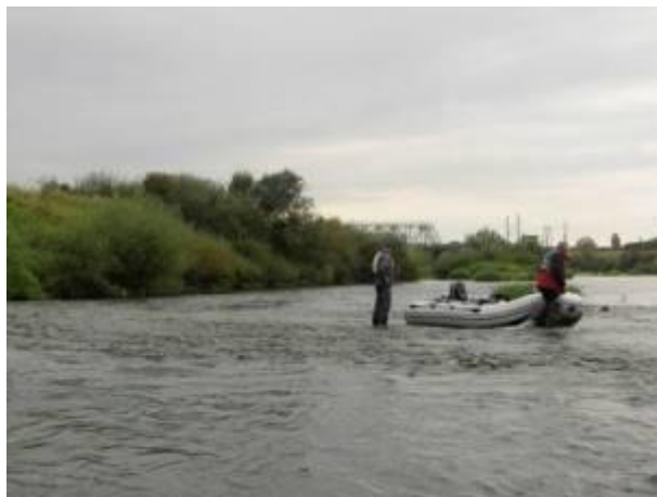
Быстрина перед ж/д мостом