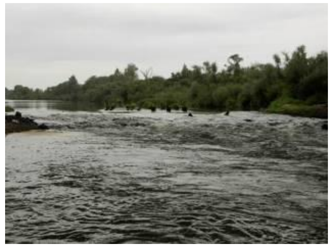
Перекат под а/м мостом трассы М1

Ниже д. Костенки по правому берегу на вершине «петли» (меандры) песчаные отмели (в большую воду они скрываются под водой): протяженные до нескольких десятков метров, но не широкие (3-5 м.) – хорошее место для купания: дно пологое, песчаное, глубина зоны купания (до 1,2 м.) – 10 м., русло в этом месте расширяется 50 м. Это первое после «Борка» приятное место для отдыха. Далее снова однообразная ровная безлесная пойма с крутыми, часто обрывистыми, берегами высотой 2-4 м., поросшими полосой ивового кустарника.