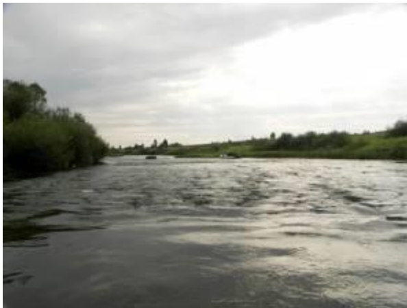
Быстрина перед ж/д мостом

Перед ж/д мостом – быстрина: дно галечно-песчаное, глубина реки 0,2-0,4 м. Непосредственно перед мостом – большая полуостровная песчаная отмель. Русло в этом месте расширяется до 50 м., глубина около 1 м. еще одно приятное место для кратковременного отдыха.