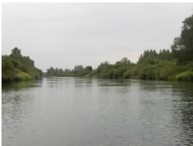
Характер берега на уч. Борок – дд. Мяхново и Зимник

После з/о «Борок» до ж/д моста («Москва – Смоленск»), на протяжении 14 км., Днепр имеет ширину 30-40 м., глубину – 1-2 м., берега низкие (около 2 м.), безлесные, с редкими ивовыми кустами вдоль речной кромки ( фото №№ 02-013, 02-014 ). По всей ширине русла на малой глубине обилие донной растительности. Река сильно меандрирует, в русле иногда встречаются небольшие низкие острова. Один из них расположен в 1,5 км. ниже «Борка», проход левой протокой.