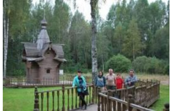
Купель на истоке Днепра

Места вблизи истока Днепра хранят следы Великой Отечественной войны. Осенью 1941 года здесь упорные бои вела 119-я Красноярская стрелковая дивизия. Большая часть воинов этой дивизии погибла, защищая исток священной реки. В память о подвиге красноярцев у истока Днепра установлена мемориальная плита и небольшой памятник.