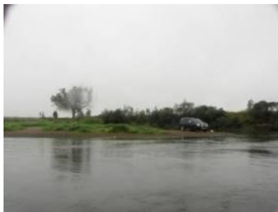
Место окончания сплава за мостом на Смоленской дороге

Удобные пологие площадки для окончания водного похода расположены на левом берегу: первая в д. Полибино перед мостом на участке дороги между г. Дорогобуж и с. Болдино, вторая – в 150 м. ниже моста: песчаная коса, подходит грунтовая дорога.