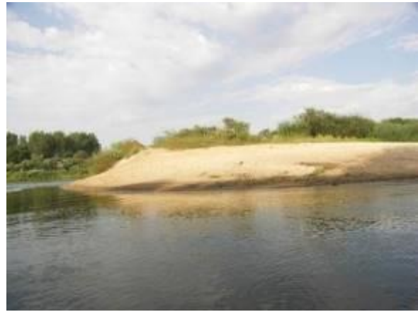
Пляжи перед Монастырщиной