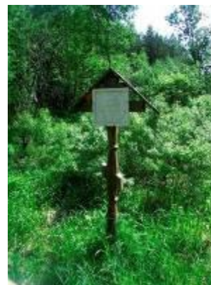
Православный крест на истоке

Исток Днепра до 2003 г. относился к категории памятников природы областного значения. Однако, учитывая, что р. Днепр является одной из крупнейших рек Европы, было решено организовать здесь особо охраняемую территорию более высокого ранга – комплексный (ландшафтный) заказник. Площадь заказника – 32,3 тыс.га. В пределах заказника находятся Гавриловское озеро ледникового происхождения, Аксеновский и Лавровский торфяники, играющие большую роль в питании Днепра в его верхнем течении.