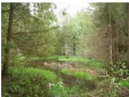
Бобровые запруды в верхнем течении

В меженный период русло реки сильно зарастает водной растительностью. Местность до Большево безлюдная, деревень нет, дороги заросли и частично заболочены в результате разливов, спровоцированных все увеличивающейся численностью бобров.