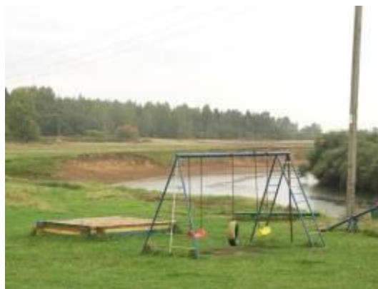
Борок, детская площадка

Пляж имеет длину около 100 м. и ширину 10-15 м. Ширина русла Днепра в этом месте около 30 м.; дно песчаное, пологое. Зона купания свободна от водорослей; ее глубина (до 1,2 м.) – 10-12 м.