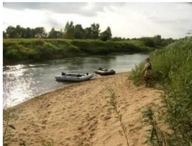
Причаливание к пляжу

В основном же характер берега остается тот же – высота 2-4 м., крутизна не менее 45°, часто берега обрывисты или густо покрытые кустарником.