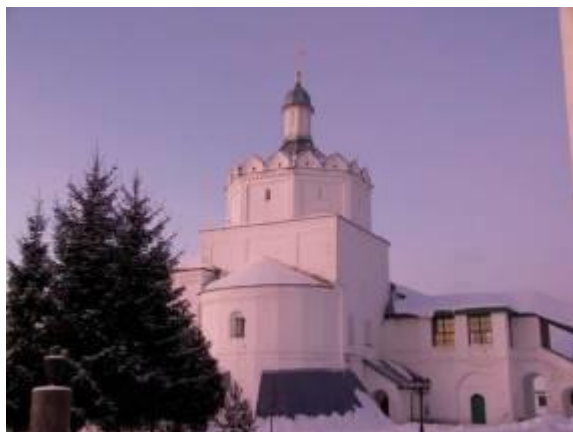
Введенская церковь Болдинского монастыря