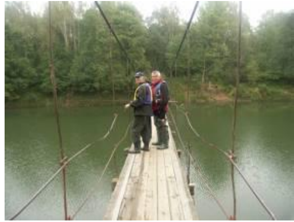
Подвесной мост в Верхнеднепровском