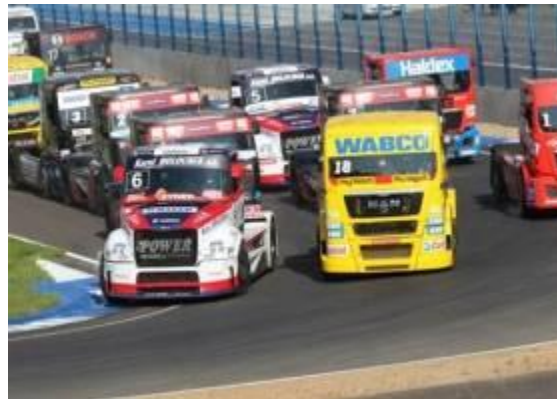
Соревнования на Смоленском кольце

Пгт Верхнеднепровский – первый крупный населенный пункт на участке от истока Днепра. Он расположен в Дорогобужском районе, в 8 км. к северо-востоку от Дорогобужа и является спутником районного центра. Численность населения (13,2 тыс. человек) больше, чем в Дорогобуже. Возник в 1952 г. в связи со строительством Дорогобужской ГРЭС. Вскоре в поселке был построен ряд крупных предприятий, работающих и в настоящее время: завод сложных минеральных удобрений (ОАО «Дорогобуж»), Дорогобужская ТЭЦ с котлотурбинными и газотурбинными установками, завод котельного машиностроения («Дорогобужкотломаш»), завод кровельных и гидроизоляционных материалов. В поселке расположены все необходимые медицинские учреждения, объекты торгового и социально-бытового обслуживания, автостанция. Сегодня Верхнеднепровский – это один из основных промышленных узлов Смоленской области.