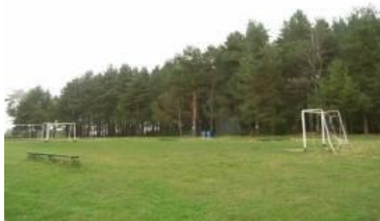
Борок: футбольная и волейбольная площадки

В прибрежной зоне расположены футбольная и волейбольная площадки, детская площадка.