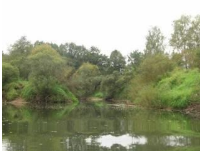
Устье р. Вопец

Далее русло реки расширяется до 40 м. Берега, вплоть до Дорогобужской ГРЭС, расположенной в пгт Верхнеднепровский, представляют собой монотонный пейзаж: ровная линия рельефа, одиночные деревья или небольшие их группы, заросли ивового кустарника вдоль кромки воды.