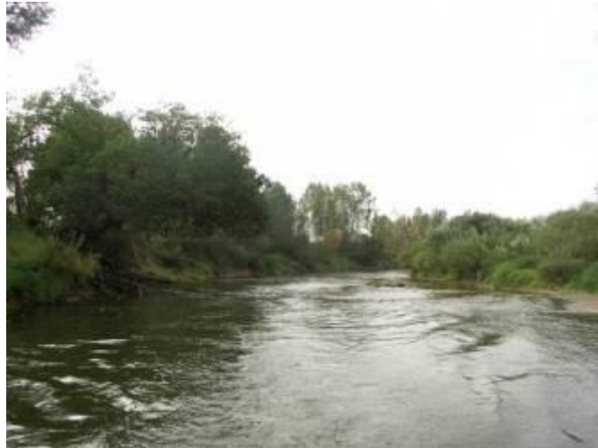
Быстрина в левой протоке

Участок: брод между дд. Мяхново и Зимник – ж/б мост в д. Полибино на Старой Смоленской дороге – 37 км.