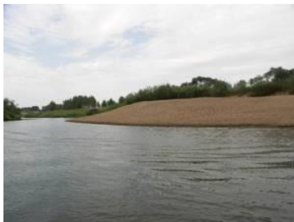
Пляж ниже д. Костенки

Ниже д. Костенки по правому берегу на вершине «петли» (меандры) песчаные отмели (в большую воду они скрываются под водой): протяженные до нескольких десятков метров, но не широкие (3-5 м.) – хорошее место для купания: дно пологое, песчаное, глубина зоны купания (до 1,2 м.) – 10 м., русло в этом месте расширяется 50 м. Это первое после «Борка» приятное место для отдыха. Далее снова однообразная ровная безлесная пойма с крутыми, часто обрывистыми, берегами высотой 2-4 м., поросшими полосой ивового кустарника.