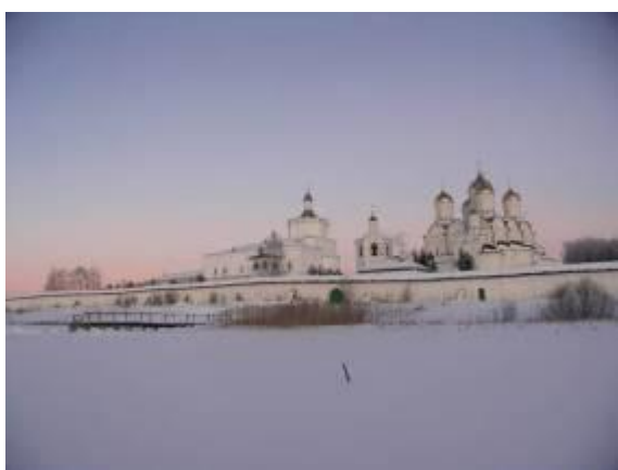
Болдинская обитель в феврале 2013 года

Основные каменные постройки в монастыре были возведены в 1580–90-х годах: пятиглавый Троицкий собор, трапезная с шатровой Введенской церковью, трехъярусная шестигранная колокольня, стены монастыря. Архитектурный ансамбль Болдинского монастыря являлся выдающимся шедевром русской архитектуры, единственным известным нам ансамблем эпохи царствования Федора Иоанновича. Выдающийся архитектор-реставратор и знаток русского зодчества, уроженец Смоленщины П.Д. Барановский высказал предположение, что в проектировании монастырского комплекса принял участие знаменитый зодчий «государев мастер» Ф.С. Конь, позже строивший каменные крепости в Москве («Белый город») и Смоленске.