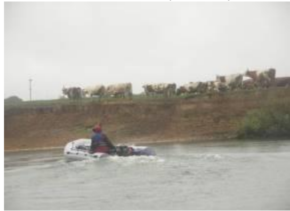
Коровы из подсобного хоз-ва ОАО Дорогобуж

Удобные пологие площадки для окончания водного похода расположены на левом берегу: первая в д. Полибино перед мостом на участке дороги между г. Дорогобуж и с. Болдино, вторая – в 150 м. ниже моста: песчаная коса, подходит грунтовая дорога.