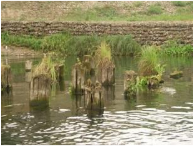
Деревянные опоры у старого моста у трассы М1